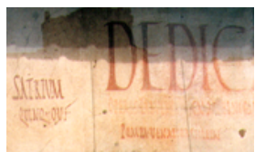
Capital Rústica, manifiesto electoral pintado sobre los muros de pompeya.

Aunque los romanos eran un pueblo literario, fue la capacidad militar la que llevó su escritura al extranjero. De este período de la historia han llegado documentos que atestiguan la evolución de las formas de la escritura manuscrita: edictos, proclamas, textos literarios, documentos comerciales.