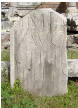
Capital Monumental del tipo Trajano, frente a la Basilica Flavia Emilia, Foro Romano.