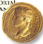
Moneda estampada con la imagen de Augusto