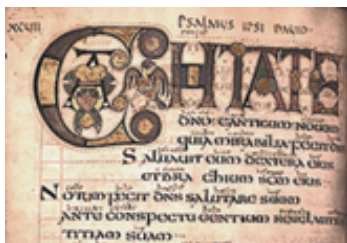
Uncial y Capital iluminada. Vespasian Psalter, Canterbury 1020.