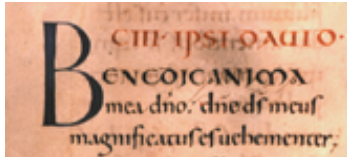
Carolingia, Uncial y Capital Romana. Harley Psalter, Canterbury, 1020