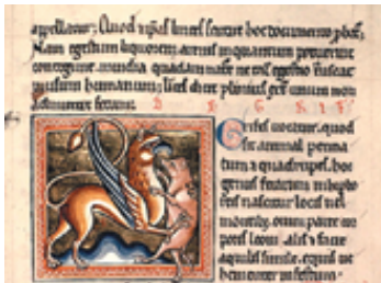
Gótica temprana, escritura previa a la Textura. Bestiario, enciclopedia ilustrada. Siglo XIII.