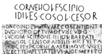
Escritura latina arcaica. Tumba de Cornelius Scipio, 300 a.C.

Las inscripciones etruscas fueron desarrolladas por medio de diferentes técnicas: escritas, acuñadas, grabadas en la piedra en tumbas y urnas funerarias. Trazadas con grafito, impresas, fusionadas en distintos materiales: bronce, plata y oro en platos, copas. Pintadas en paredes y edificios. Estampadas en terracota sobre anforas y vasos. Acuñadas o fundidas en monedas y esculturas.