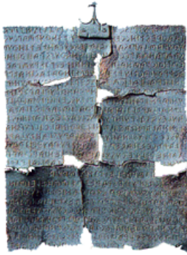
Tablas de Cortona, escritura grabada en bronce.