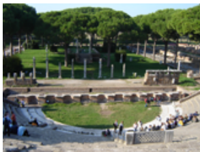
Anfiteatro, Ostia Antica

El curso introduce a los participantes a la maravillosa herencia artística y cultural del pueblo etrusco, sus influencias en la escritura latina y el desarrollo del Imperio Romano. A través de la observación minuciosa y el dibujo al natural. El itinerario está estructurado de modo tal, que sea un viaje de estudio como de recreación y placer