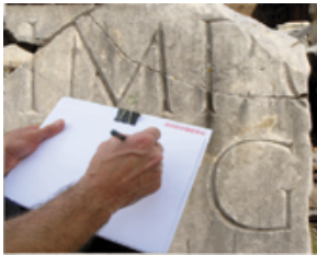
Documentación en campo.